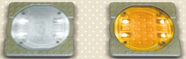
車線変更禁止線用